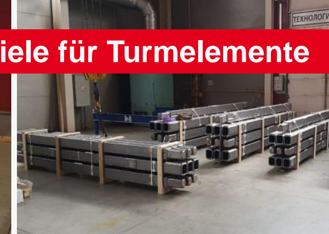
Eckstiele für Turmelemente