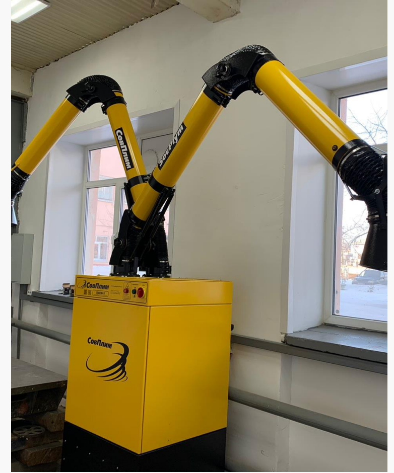
Abzugsanlage für Schweißer-Werkstatt WOLFF in College Kolomna, übergeben von WK 000