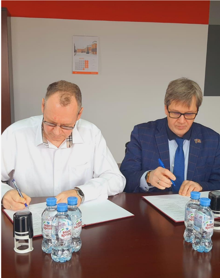
Vertragsunterzeichnung im Dezember 2021