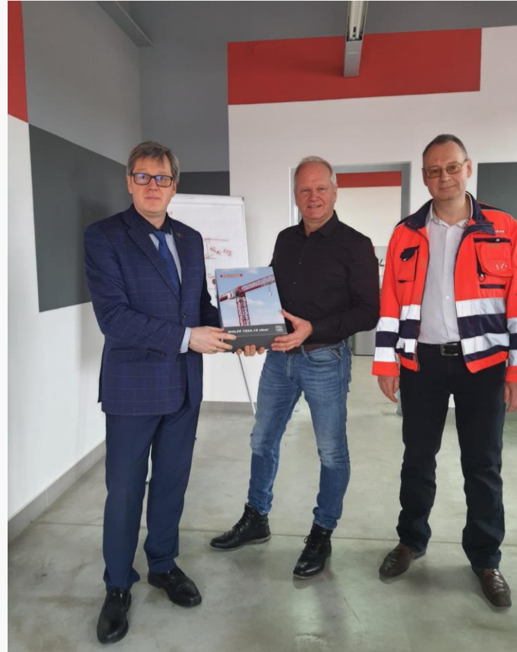
Übergabe eines WOLFFKRANS bei Vertragsunterzeichnung